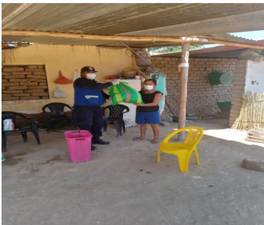
APOYO PARA DISTRIBUCION DE CANASTAS FAMILIARES