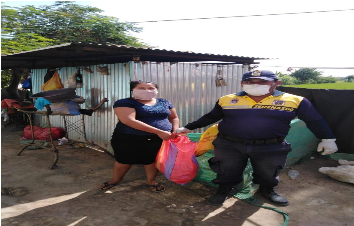
PERSONAL DE SERENAZGO MUNICIPAL, APOYO PARA DISTRIBUIR 4,329 CANASTAS FAMILIARES A LAS FAMILIAS VULNERABLES DE LA ZONA RURAL DE MORROPE Y SEGÚN APLICATIVO CGR.