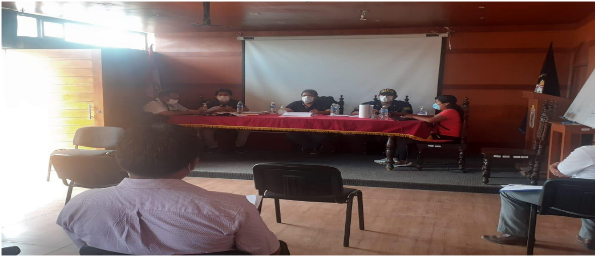
COMITÉ MULTISECTORIAL COVID 19 DISTRITO DE MORROPE

4.1. (OPERATIVOS O PATRULLAJE MIXTO DIURNO Y NOCTURNO PNP, FF.AA. Y SERENAZGO MUNICIPAL) -Operativos inopinados a los vehículos menores que no acataban las prohibiciones del aislamiento (toque de queda y no portar autorizaciones tránsito peatonal y vehicular detenciones personales a la comisaria de Mórrope o cruz del médano y vehicular al depósito municipal.