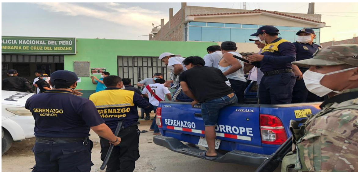
MOVILIDADES DE SERENAZGO MUNICIPAL-EN OPERATIVO MIXTOS PNP.CRUZ DEL MEDANO