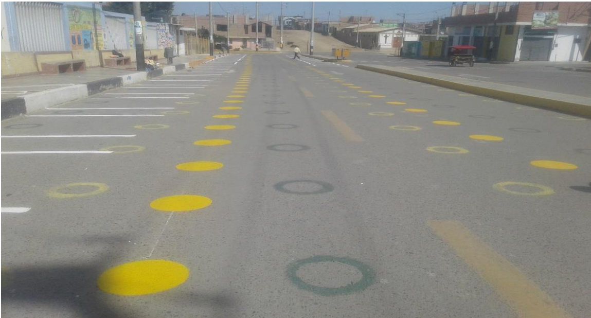
SEÑALIZACIONES PARA AISLAMIENTO SOCIAL MEDIDAS REGLAMENTARIAS SEGÚN MINS