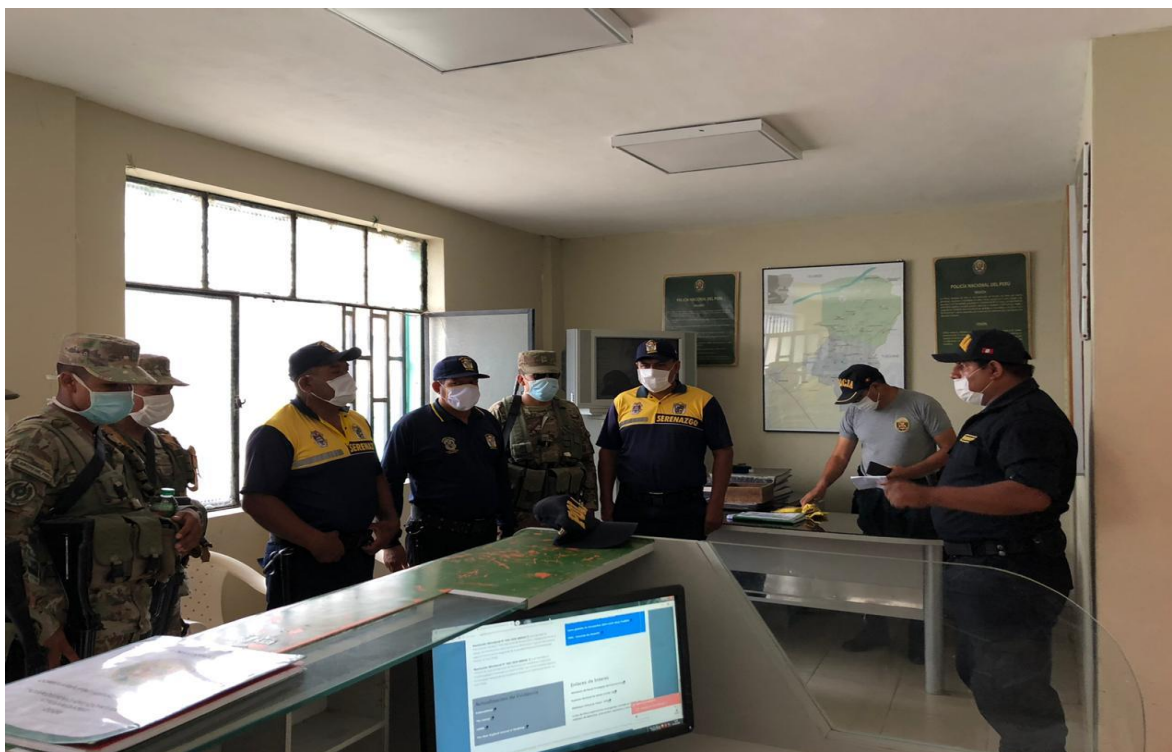
AQUÍ EN COMISARIA CRUZ DEL MEDANO-CONCLUSIONES AL FINAL DEL PATRULLAJE MIXTO