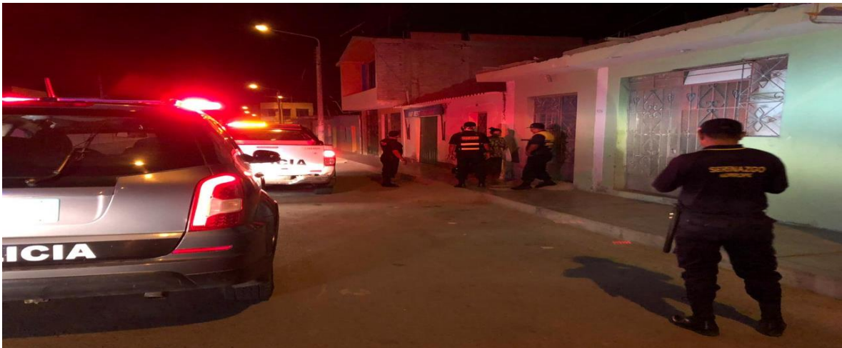
SECRETARIA TECNICA CODISEC MORROPE-COORDINACION PNP MORROPE Y CRUZ DEL MEDANO