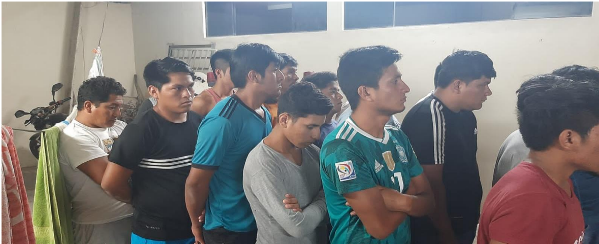
OPERATIVOS EN LA ZONAS DE LA ZONA URBANA Y RURAL- DETENCIONES A COMISARIAS